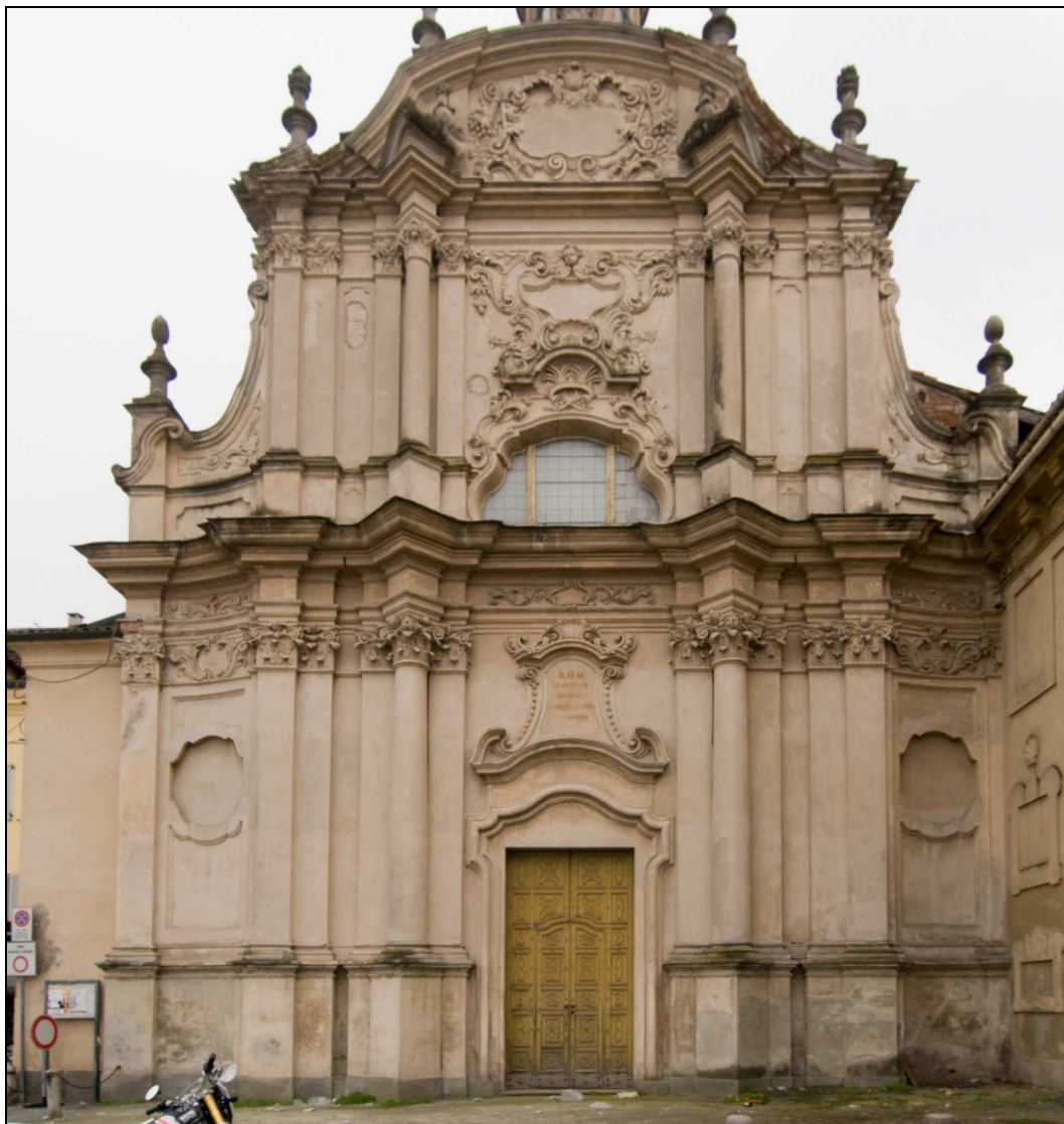
Figura n. 20 – La facciata principale