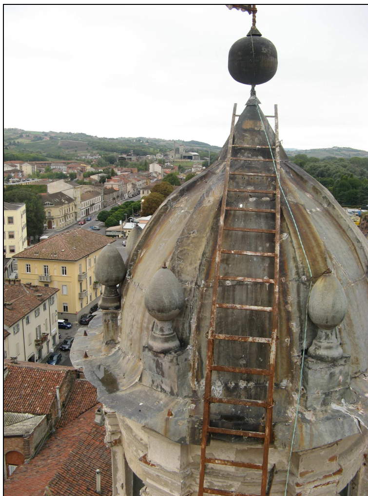
Figura n. 4 – Degrado della copertura in rame