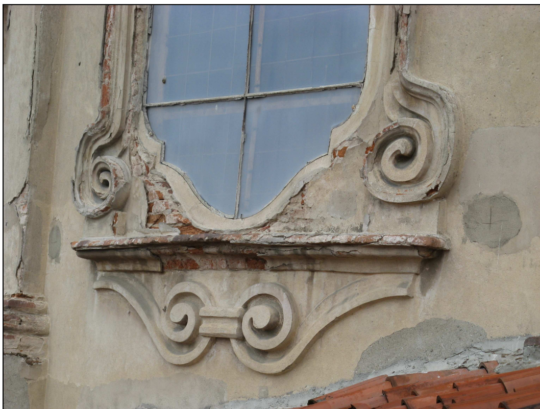
Figura n. 16 – Tamburo – Degrado elementi architettonici finestroni