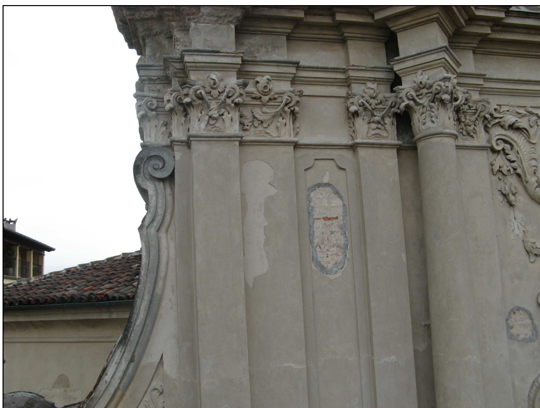
Figura n. 29 – Intonaco mancante