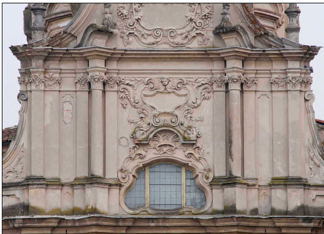
Figura n. 26 – Dettaglio della facciata