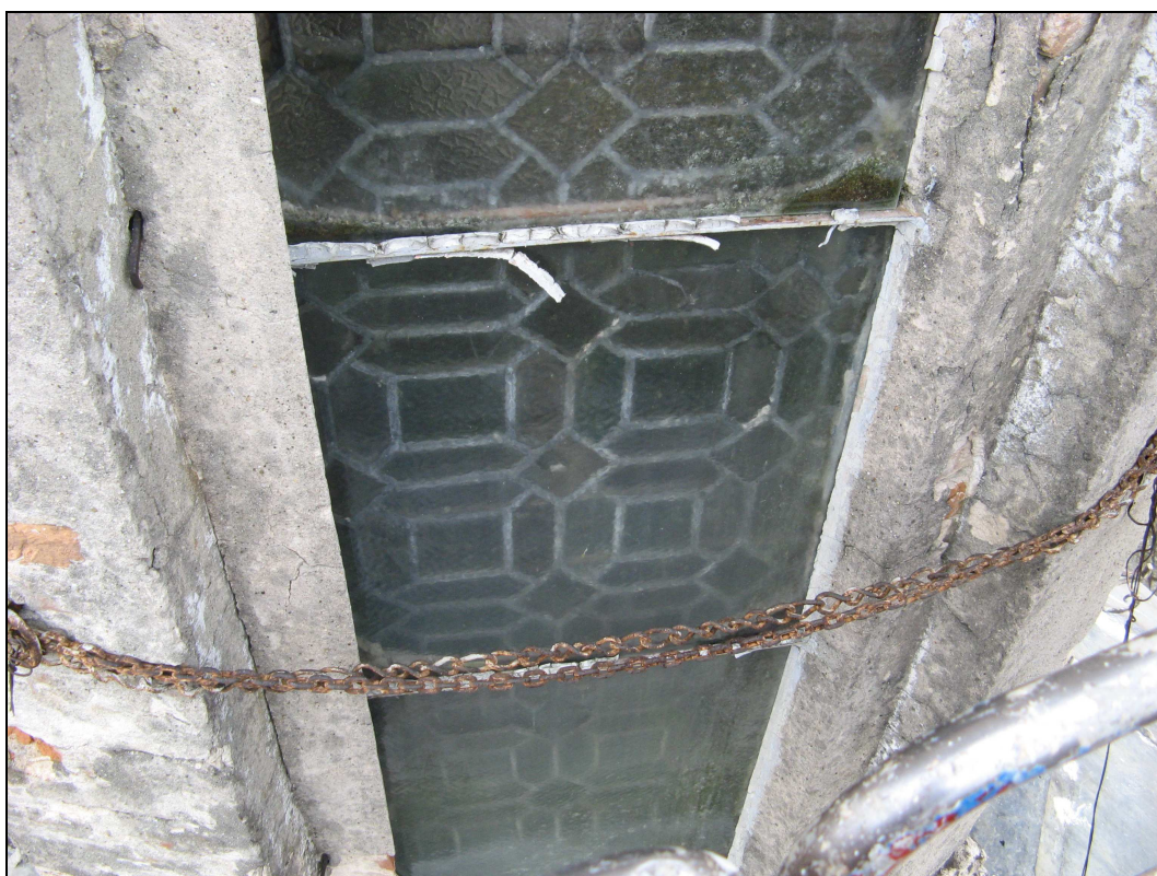
Figura n. 7 – Degrado dei serramenti