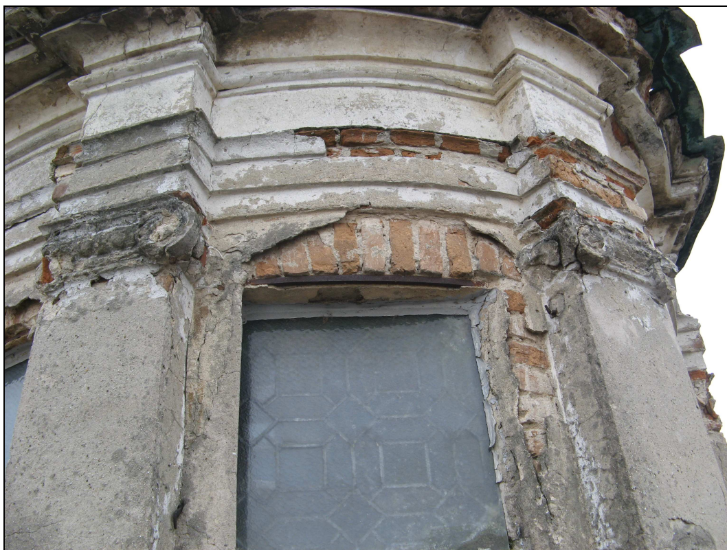
Figura n. 6 – Degrado degli elementi architettonici