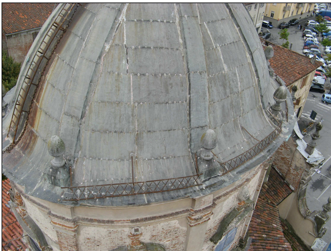
Figura n. 10 – Cupola - Copertura in rame ammalorata