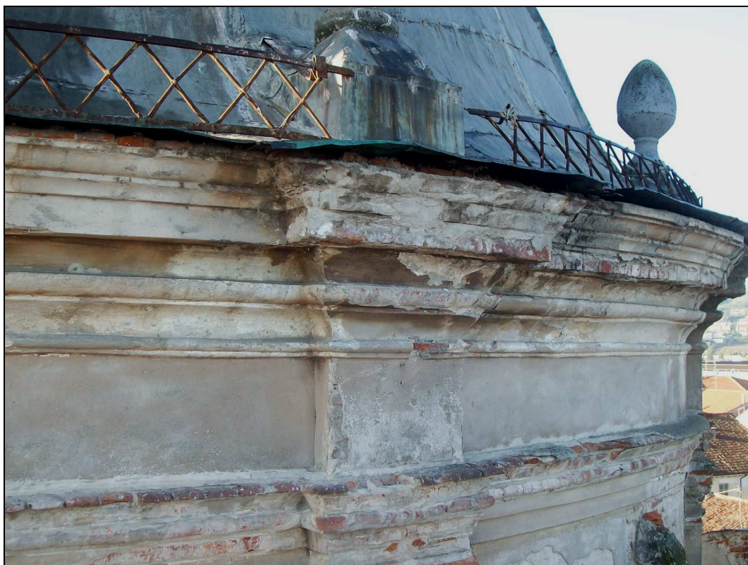
Figura n. 12 – Tamburo - Degrado cornici