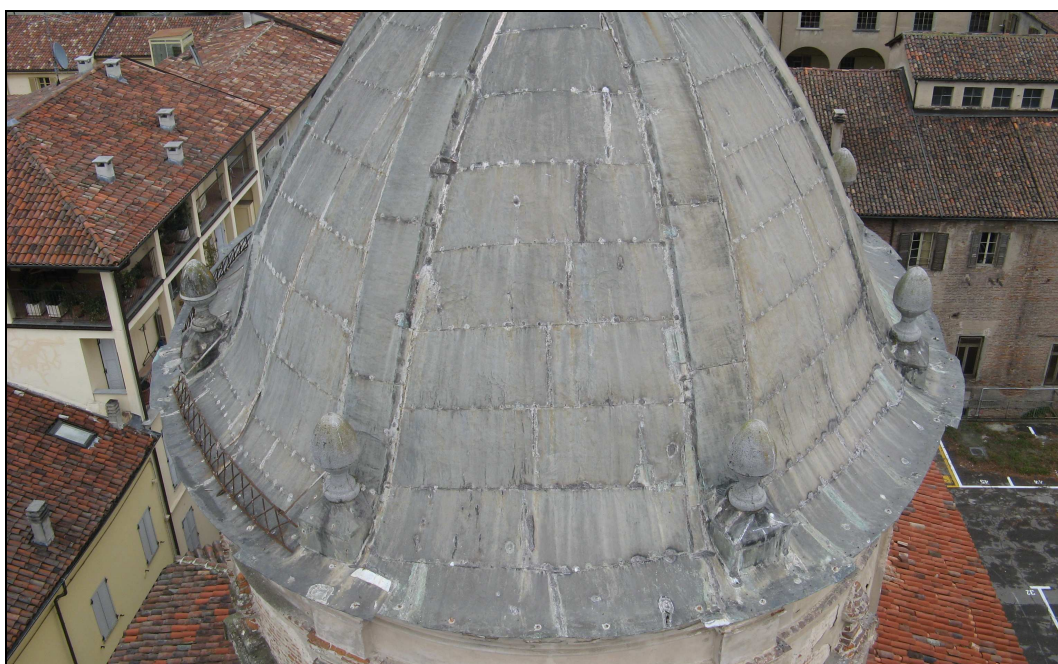
Figura n. 9 – Cupola - Copertura in rame ammalorata