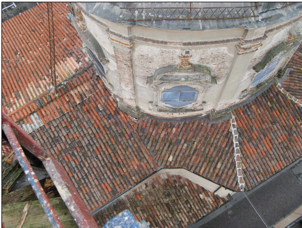
Figura n. 18 – Copertura ammalorata