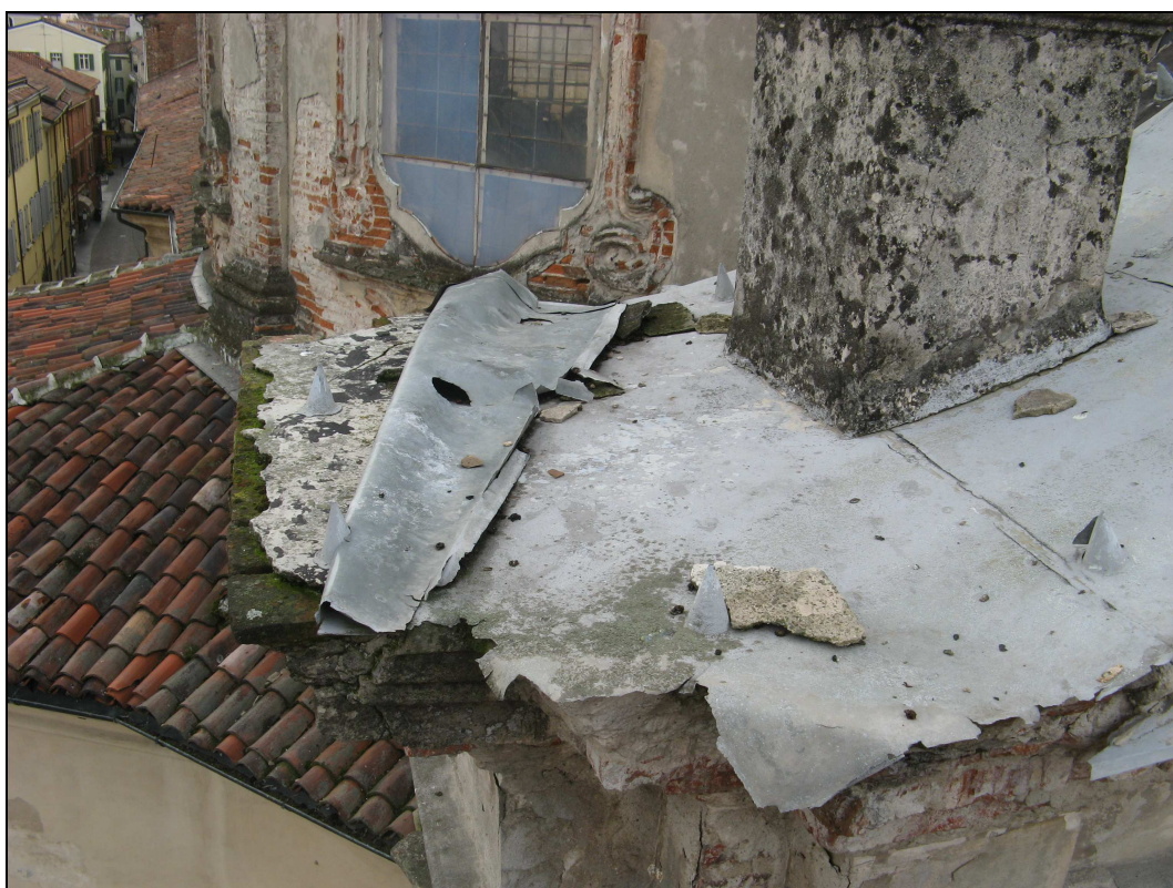
Figura n. 23 – Degrado del timpano