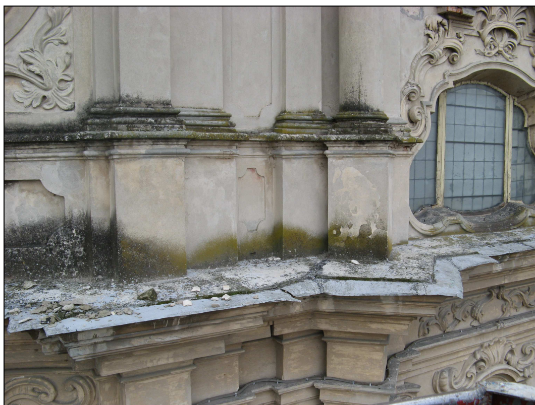
Figura n. 27 – Macchie di umidità sulla facciata