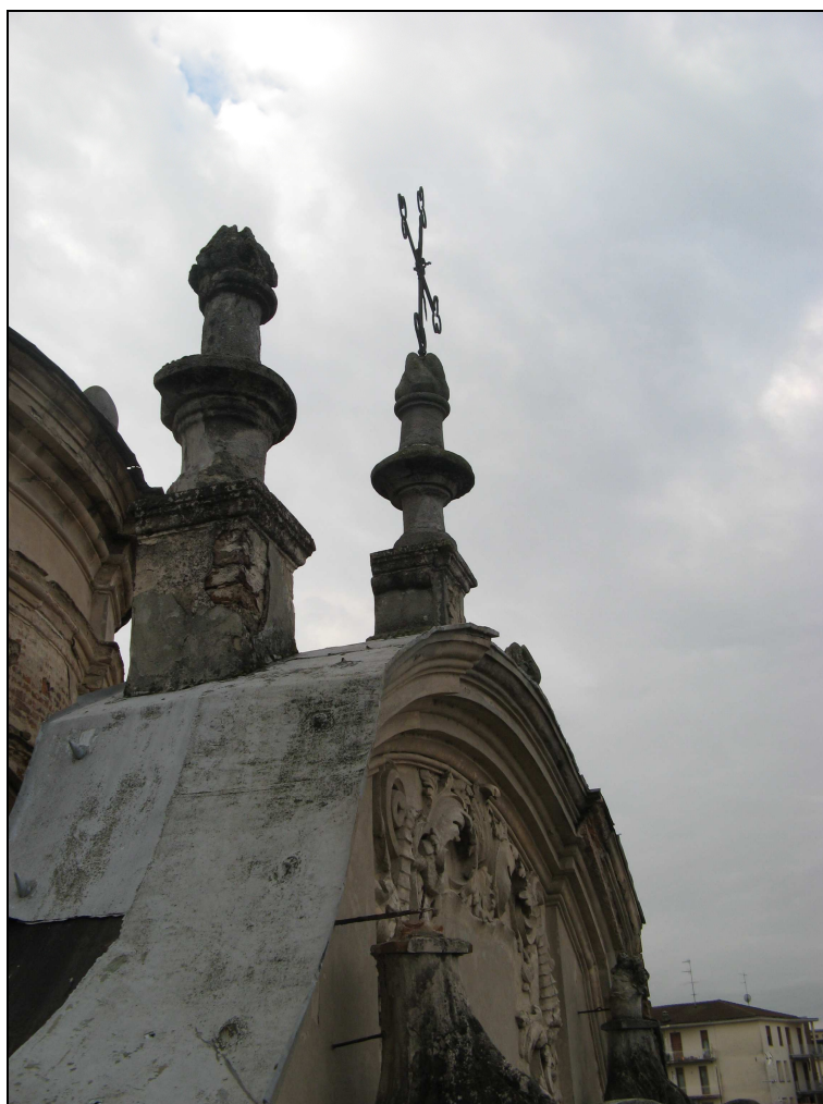
Figura n. 25 – Degrado di pinnacoli e croce sommitale