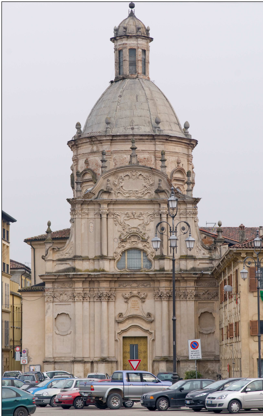
Figura n. 1 – Vista frontale della Chiesa di Santa Caterina