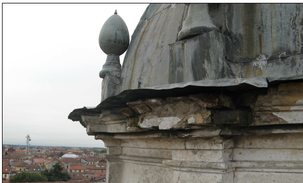
Figura n. 3 – Degrado di cornicioni e copertura