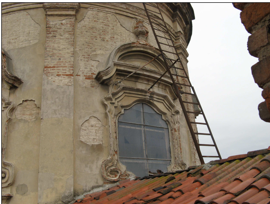
Figura n. 15 – Tamburo - Degradamento intonaco