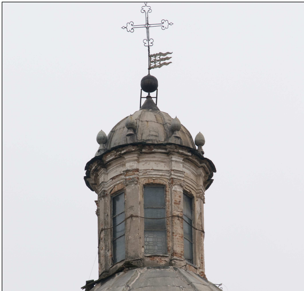
Figura n. 2 – La lanterna