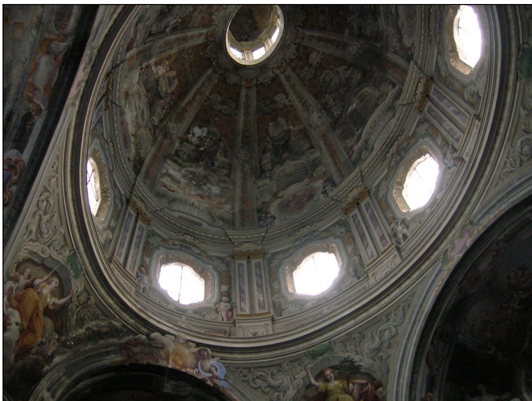
Figura n. 17 – Interno cupola e tamburo