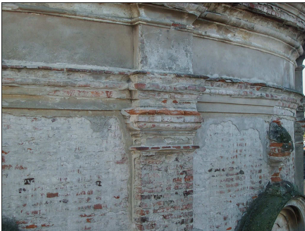
Figura n. 13 – Tamburo - Degrado cornici, intonaco ed elementi architettonici