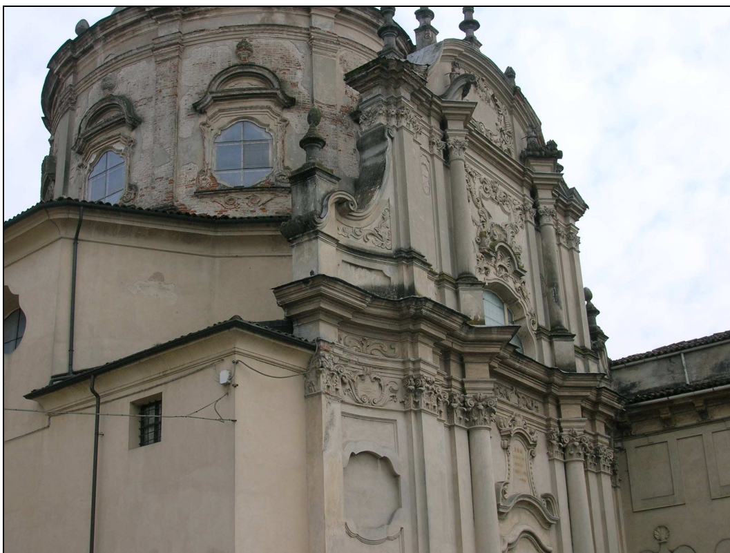
Figura n. 32 – Facciata principale e tamburo