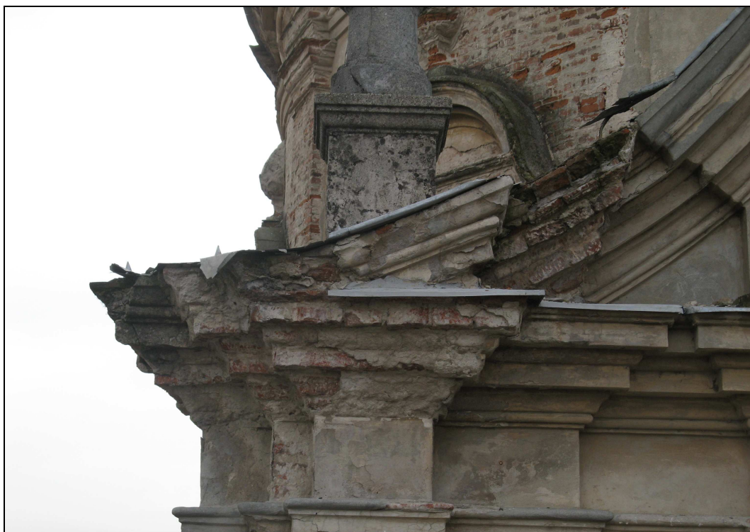
Figura n. 24 – Degrado delle cornici