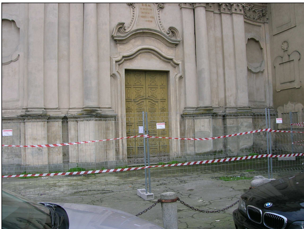
Figura n. 31 – Il portone di ingresso