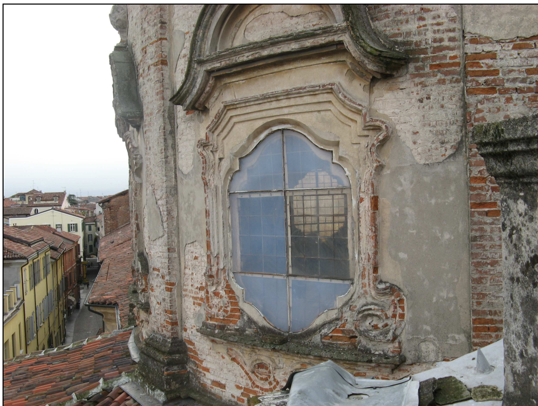
Figura n. 14 – Tamburo - Degradamento cornici, intonaco ed elementi architettonici