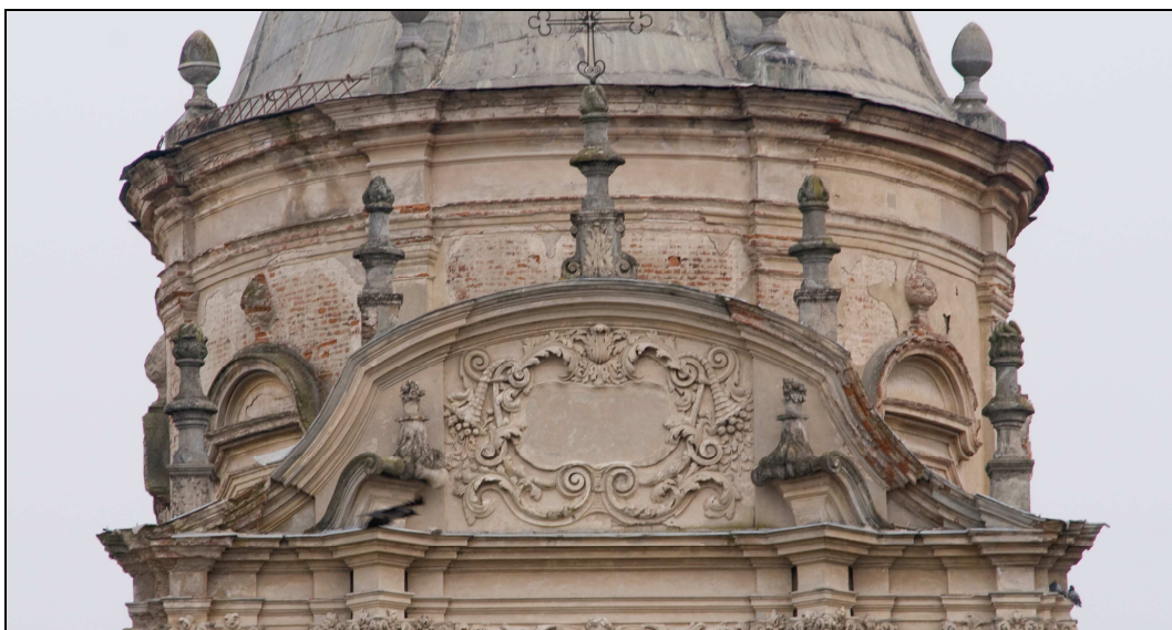
Figura n. 21 – Dettaglio del timpano