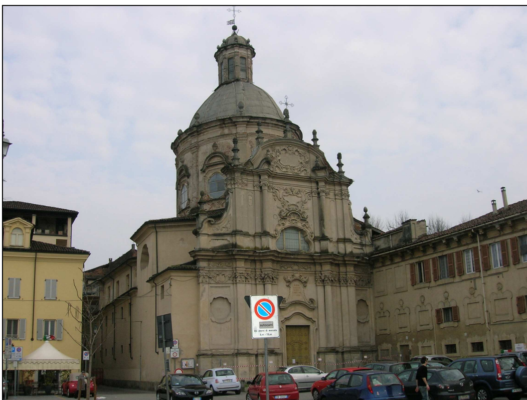
Figura n. 33 – La Chiesa di Santa Caterina