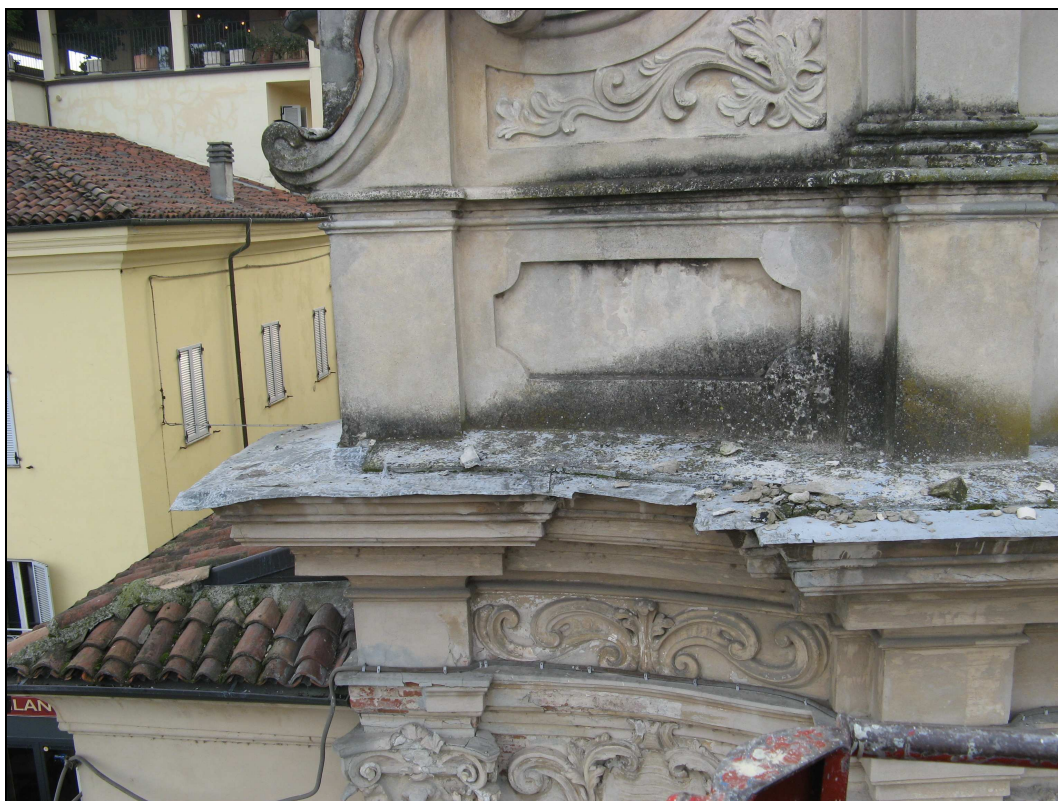
Figura n. 28 – Macchie di umidità sulla facciata