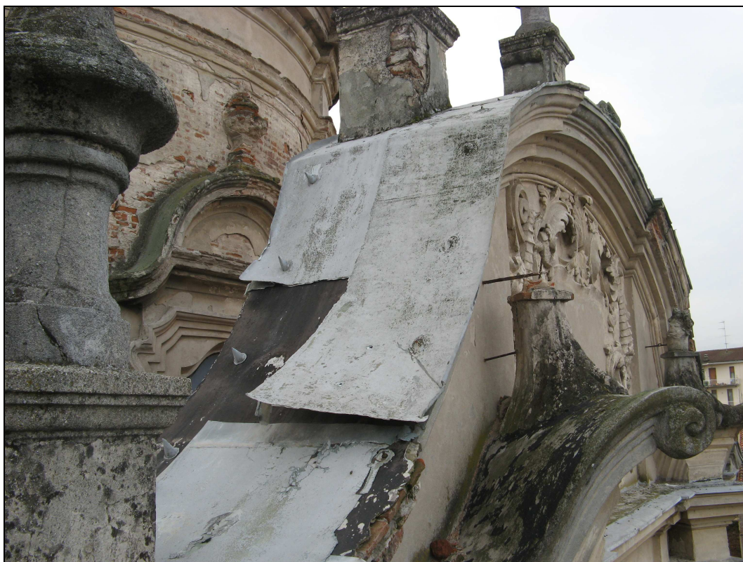
Figura n. 22 – Degrado del timpano