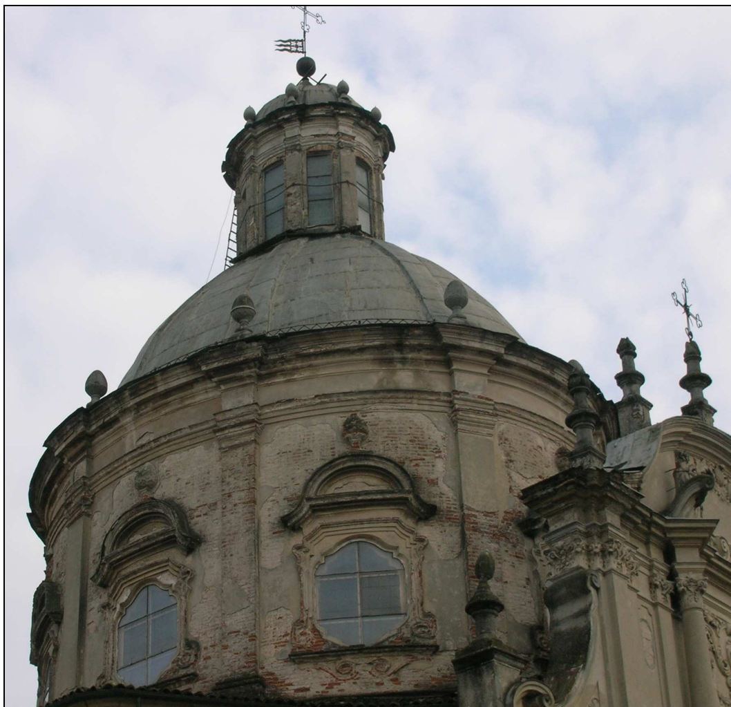
Figura n. 8 – Cupola e tamburo