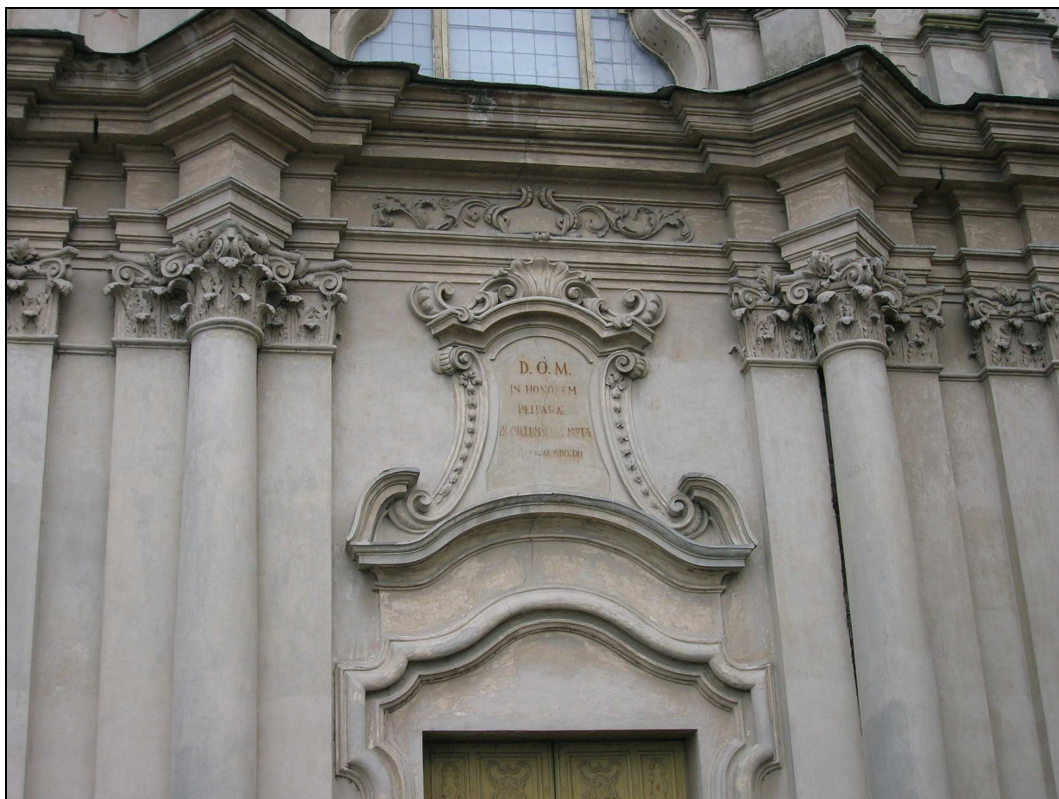
Figura n. 30 – Dettaglio della facciata principale