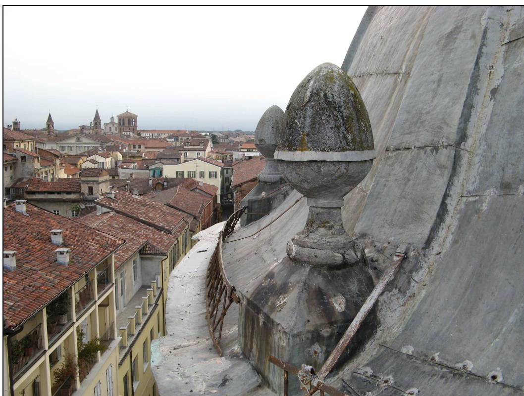
Figura n. 11 – Cupola - Degrado pinnacoli in rame